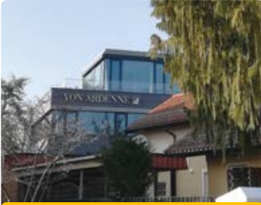
Gebäudekomplex VON ARDENNE

Laufen Sie die Bergbahnstraße entlang, bis diese in die Plattleite übergeht. Hier halten Sie sich rechts und gehen dann weiter geradeaus. Auf der linken Seite sehen Sie zuerst die Firmengebäude und dann die Sternwarte von Baron Manfred von Ardenne (3) , welcher hier das größte private Forschungslabor des ehemaligen Ostblocks betrieb.