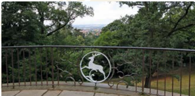
Aussicht vom Friedensblick (4)