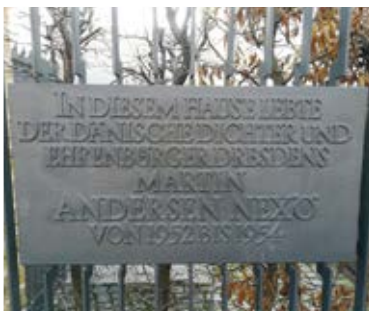
Gedenktafel Martin A. Nexö (5)

auf Einladung des damaligen sächsischen Ministerpräsidenten Max Seydewitz nach Radebeul über und ließ sich 1952 schließlich im Dresdner Stadtteil Weißer Hirsch nieder. Dort verstarb er 1954 im Alter von 84 Jahren. Er war dreimal verheiratet und hatte zehn Kinder.