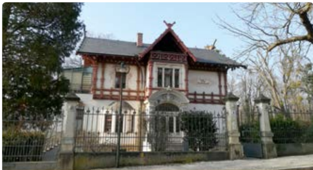
Villa Eschebach (8)