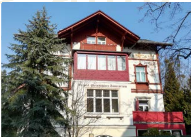
ehemaliges Sanatorium Steinkühler (6)

Die Straße geht in die Küntzelmannstraße über, der Sie rechter Hand folgen. Kurz darauf kreuzt die Wolfshügelstraße, in die Sie links einbiegen. Direkt an der Kreuzung mit der Küntzelmannstraße sehen Sie am Haus mit der Nummer 7 das ehemalige Sanatorium Steinkühler (6) .