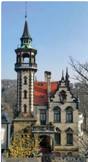
Villa San Remo (2)