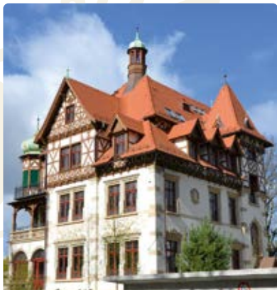
Villa Heinrichshof (10)

dem Ersten Weltkrieg Viktoria Luise von Preußen, Heinz Rühmann, Johannes Heesters, Zarah Leander, Heinrich Büssing, Hugo Junkers u. v. a. mehr. Mit Ausbruch des zweiten Weltkrieges zog 1939 die Wehrmacht auf das Gelände, danach diente es als sowjetisches Militär Lazarett. Seit 2011 wird es umfassend saniert.