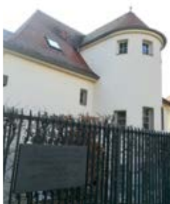
Haus Nr. 4