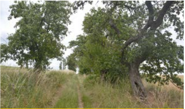
Allee mit alten Obstbäumen (4)