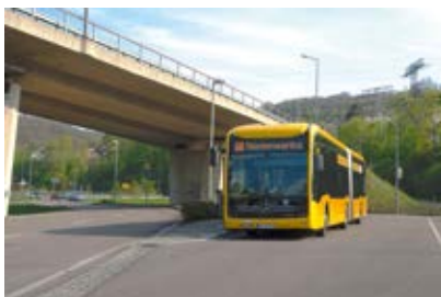
Haltepunkt Niederwartha (1)

Wir starten am Haltepunkt Niederwartha (1) , den Sie mit der Buslinie 68 erreichen. Über die Elbe spannt sich hier die 2008 für den Autoverkehr fertiggestellte Schrägseilbrücke,