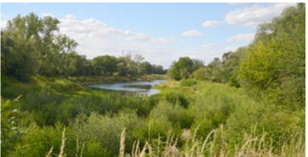
Stausee Oberwartha (5)

Unkersdorfer Landstraße und biegen Sie nach rechts in einen Weg etwas abseits vom Ufer des Stausees Oberwartha (5) ein. Der Stausee ist der obere Wasserspeicher des Pumpspeicherwerks Niederwartha und hat eine Flächenausdehnung von 30 Hektar und ein Wasserspeichervolumen von 2,9 Millionen Kubikmetern. Zur Energieerzeugung stürzt das Wasser mit einer Fallhöhe von 143 Metern durch drei 1760 Meter lange Rohre, um Wasserkraft zu erzeugen.