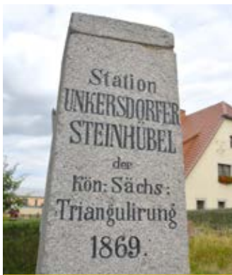
erneuerte Triangulationssäule (7)

Sie weiter durch das Dorf zu einer erneuerten Triangulationssäule (7) .