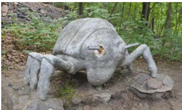
steinerne Skulptur einer Reblaus

Die im Zweiten Weltkrieg durch Brandstiftung zerstörte Blechburg ist ein ehemaliger Aussichtsturm von einst siebzehn Metern Höhe mit achteckigem Grundriss. Ein großes Brunnenbecken und eine Aussichtsbastion an der Hangkante gehören zum Ensemble und sind bis heute erhalten geblieben.