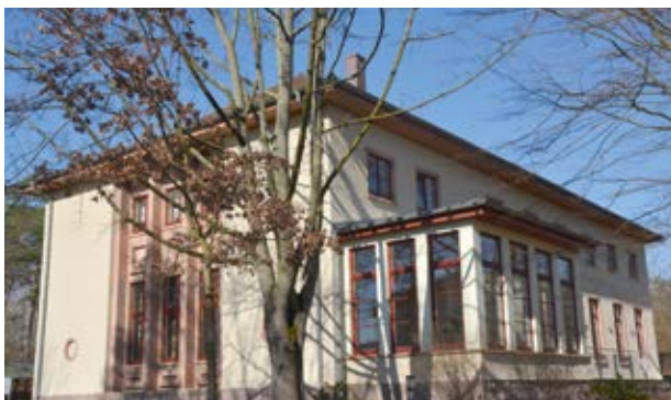
ehemaliges Offizierscasino (3)

Sie folgen der Hellerhofstraße. Zahlreiche Gebäude zeugen davon, dass das Gelände zwischen 1937 und 1991 durch das Militär genutzt wurde. Sie laufen an einem ehemaligen Offizierscasino (3) vorbei, das mittlerweile als Seminarraum