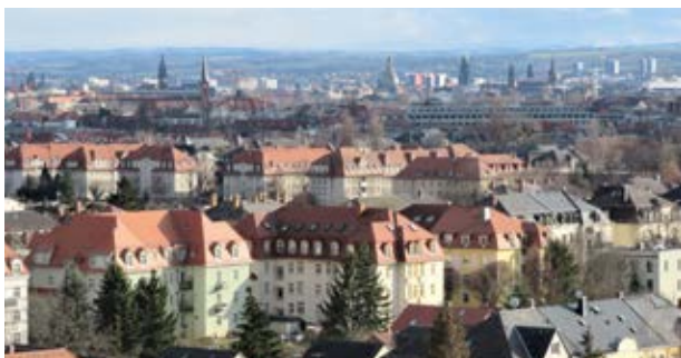
Blick vom Panoramaweg

bewegter Geschichte. Bis Ende des 19. Jahrhunderts ein beliebtes Ausflugsziel, wurde es während des Zweiten Weltkrieges als Reservelazarett und nach 1945 als Parteischule der SED genutzt. Ab 1969 verwendete das DDR-Fernsehen und später der MDR die Räumlichkeiten als Fernsehstudio. 2007 wurde es zum Wohn- und Bürohaus umgebaut. Nach überqueren der Weinbergstraße biegen Sie rechts in einen gepflasterten Fußweg ein und streifen das Gelände des Berufsförderungswerks (BFW) Dresden. Hier können sich Menschen, die ihre bisherige Tätigkeit aus gesundheitlichen Gründen nicht mehr ausüben können, beruflich neu orientieren und qualifizieren. Südlich des abgegrenzten Gebietes kommen Sie zum Panoramaweg (2) und erreichen oberhalb der Kleingärten