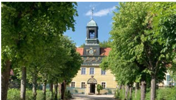
Villa Sorgenfrei (11)

Wir wünschen Ihnen eine angenehme Heimfahrt.