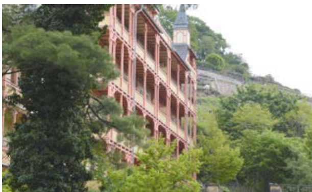
ehemaliges Bilz-Sanatorium (9)

11 Sie biegen nun nach links in die Straße ein und überqueren den neugestalteten Eduard-Bilz-Platz. Kernstück ist die Edelstahlplastik „Nymphe“, die der Figur auf einer Werbetafel aus dem Jahr 1907 für das Bilzsche Licht-Luft-Bad nachempfunden wurde. Rechter Hand haben Sie Blick zur Villa Sorgenfrei (11) , einer der architektonisch bedeutendsten Herrensitze der Lößnitz. Das 1783 entstandene, zweigeschossige Herrenhaus gilt als das letzte erhaltene Gebäude im Dresdner Zopfstil, ein Stil im Übergang zwischen Rokoko und Klassizismus von 1760 bis 1790, der sich durch zopfförmige Blattornamente auszeichnet.