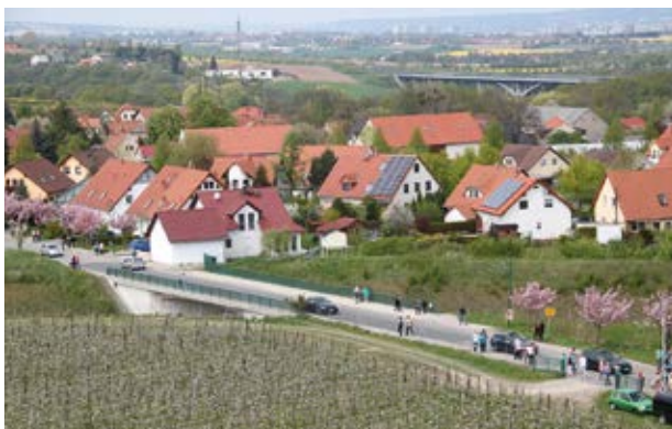
Blick über Borthen in Richtung Dresden (4)

Borthen liegt an der Stadtgrenze Dresdens auf einer Hochfläche zwischen dem Lockwitzbach im Westen und der Müglitz im Osten. Es entstand als slawische Siedlung in Form eines Rundlings, der bis heute recht gut erhalten geblieben ist. An Einfamilienhäusern vorbei kommen Sie zum Dorfplatz mit Teich und den typischen Bauernhäusern. Rund um Borthen wird intensiver Obstanbau betrieben. Dabei sind nicht nur die bekannten Apfelbäume zu finden, es werden auch Erdbeeren, Himbeeren, Kirschen, Pflaumen und Birnen