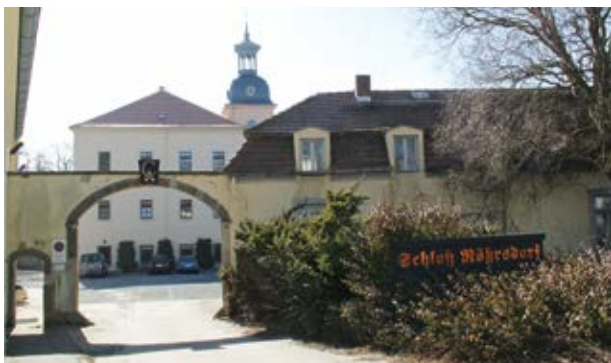
Röhrsdorfer Schloss (5)

Gehen Sie weiter nach links. Nach sechshundert Metern auf dem Fußweg der Röhrsdorfer Straße in Richtung Röhrsdorf gelangen Sie zum Sitz der Erzeugergemeinschaft Borthener Obst e. G., einem Sächsisch-Böhmischen Bauernmarkt und dem Röhrsdorfer Schloss (5) . Das Anwesen wurde