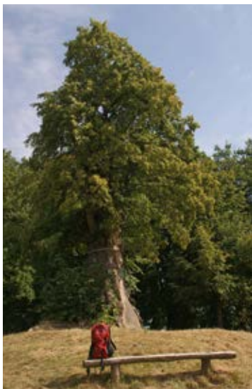
Burgstädteler Linde (14)

obstwiesen Aussicht auf das Kreischauer Becken, den Wilisch und den markanten Höhenzug der Quohrener Kipse im Erzgebirgsvorland.