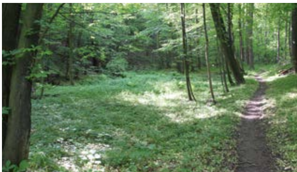
Durch den Röhrsdorfer Grund