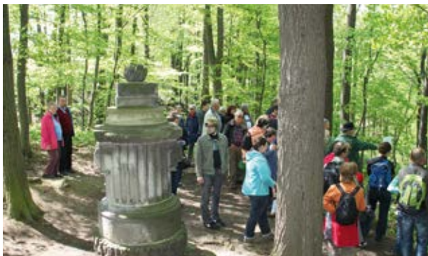
Röhrsdorfer Park (7)