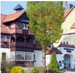
ehemalige Weltemühle (11)

Unmittelbar hinter dem Bad führt eine Treppe hinunter in den schattigen Grund. Eine wuchtige Mauer aus dem 90 Millionen Jahre alten Pläner vom Grunde des Kreidemeeres schützt Ihren Weg. Er wird auch „Plauener Stein“ genannt, nach dem Entdeckungsort Dresden-Plauen. Schon ist die ehemalige Weltemühle (11) am Ausgang des Tales erreicht. Sie avancierte nach 1870 zu einem beliebten Ausflugsziel im Dresdner Westen.