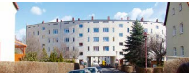
Briesnitzer Rundling (14)

Von der Haltestelle Gottfried-Keller-Straße der Linie 1 gelangen Sie zurück ins Stadtzentrum. Wir wünschen Ihnen einen angenehmen Heimweg.