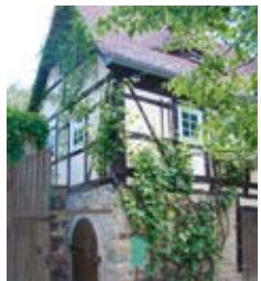
Zschoner Mühle (4)

Ein Mühlgraben mit seinen Schützen ist Vorbote der Zschoner Mühle (4) . Vermutlich schon im 15. Jahrhundert erbaut, entwickelte sie sich Ende des 19. Jahrhunderts zu einem beliebten Ausflugslokal. 1917 wurde der Mahlbetrieb, 1950 die Bewirtung eingestellt. Nach jahrzehntelangem Verfall haben 1985 Rekonstruktions- und Restaurationsarbeiten begonnen, um die Mühle wieder originalgetreu aufzubauen. Zuletzt wurde im Jahr 1991 das größte funktionstüchtige oberschlächtige Wasserrad Sachsens mit einem Durchmesser von 6,20 Metern eingebaut. In den Sommermonaten können Sie im schattigen Biergarten eine Pause