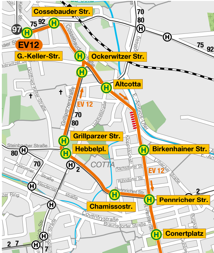
EV 12 Ebertplatz

Fahrtweg EV 12 von 08.06., 04:15 Uhr bis 12.06., 15:00 Uhr