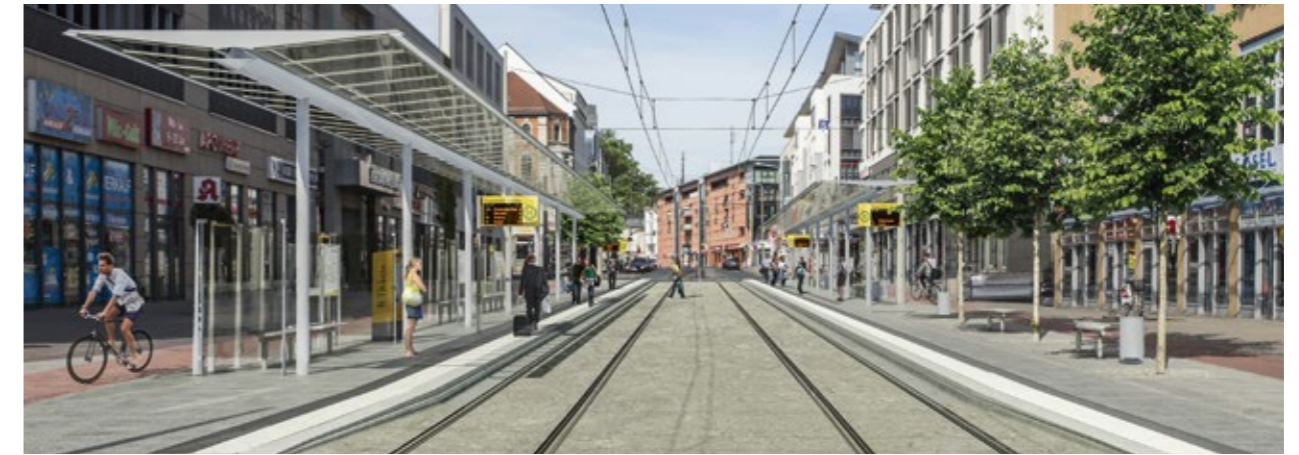
So wird die neue Doppelhaltestelle Löbtau, Tharandter Straße aussehen.

Neben dem barrierefreien Ausbau der Haltestelle als Doppelhaltestelle für Straßenbahnen und Busse sowie der Erneuerung der Fahrleitungen werden auch neue Gleise mit einem Gleisabstand von 3 Metern verlegt. Diese ermöglichen den zukünftigen Einsatz der neuen größeren Stadtbahnwagen. Weiterhin erfolgt ein komplexer Straßenausbau inklusive Medien, Signalanlagen, öffentlicher Beleuchtung sowie Rad- und Gehwegen auf einer Länge von 300 Metern.