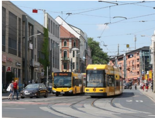
Die heutige Haltestelle Löbtau, Tharandter Straße.

Ab dem 20. Juni 2018 beginnen wir mit den vorbereitenden Baumaßnahmen für den umfangreichen Ausbau der Kesselsdorfer Straße zwischen Tharandter und Reisewitzer Straße. Damit wird der unfallträchtige Abschnitt entschärft und eine barrierefreie Haltestelle mit großzügiger Überdachung geschaffen. Das ermöglicht künftig vor allem mobilitätseingeschränkten Fahrgästen, Senioren und Fahrgästen mit Kinderwagen oder Fahrrad einen sicheren und bequemen Ein- und Ausstieg.