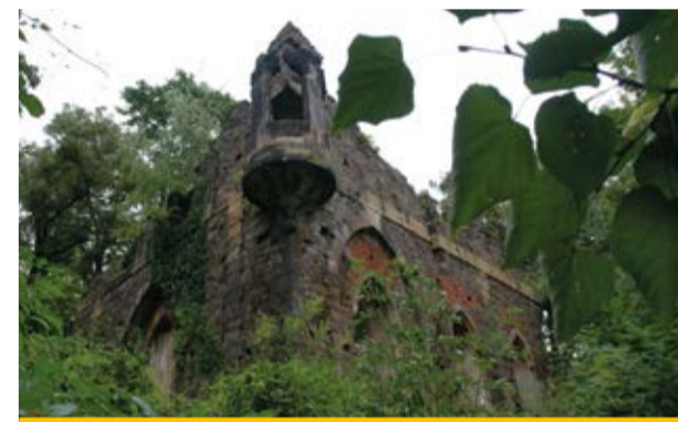
künstliche Ruine (13)

Von Abzweigen lassen Sie sich nicht beeindrucken, sondern folgen dem sich windenden Wegverlauf, der langsam an Höhe verliert. Im Laufe des Weges wird auch die Grün-Strich-Markierung des Weges kontinuierlicher. Nach zwei Kilometern des Jagdweges überqueren Sie – noch immer im Wald wandernd – die Straße von Pillnitz bis Borsberg. Auch nach der Straßenüberquerung folgen Sie dem Grün-Strich markierten Jagdweg. Rechter Hand blicken Sie in den Friedrichsgrund und gelangen zu einer künstlichen Ruine (13) , die 1785 im neogotischen Stil errichtet wurde. Sie entstand im Bereich einer mittelalterlichen Wehranlage und symbolisiert die Vergänglichkeit alles Geschaffenen. An der Ostseite der Ruine wurde 1872 eine Ehrensäule anlässlich des 50. Ehejubiläums (14) für König Johann und dessen Gattin Amalie Auguste errichtet.