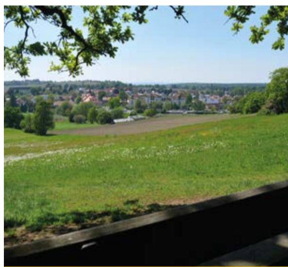
Blick vom Weißiger Hutberg (2)

Wir starten unseren Streifzug in Weißig (1) , einem östlichen Ortsteil von Dresden, der erst 1999 eingemeindet wurde. Mit der Buslinie 61 fahren Sie bis zur Haltestelle Am Gasthof Weißig. Die Wanderung beginnt hinter dem Gasthof. Bereits hier macht eine Informationstafel auf unser erstes Ziel, den Napoleonstein, aufmerksam. Folgen Sie dem mit dem grünen Punkt markierten Schönfeld-Weißiger-Bergweg (SWB) an der östlichen Ecke des Parkplatzes, der Sie leicht aufwärts zum Weißiger Hutberg (2) leitet. Wanderer, die nicht über den Hutberg steigen möchten, nehmen vom Parkplatz den Weg, der direkt in zweihundert Metern zur Mauer des Weißiger Kirchfriedhofes führt.