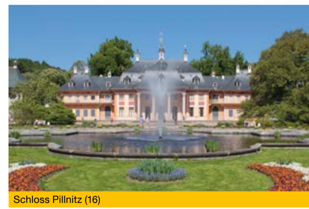
Schloss Pillnitz (16)

Nach knapp vierzehn Kilometern haben Sie das Ziel unseres Streifzuges erreicht. Mit der Buslinie 63 können Sie von der Haltestelle Rathaus Pillnitz den Heimweg antreten. Falls Sie noch mehr erkunden möchten, empfehlen wir Ihnen einen Spaziergang durch den Schlosspark Pillnitz oder einen Besuch des Museums im Palais (16) .