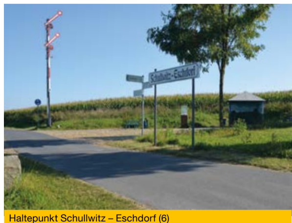
Haltepunkt Schullwitz – Eschdorf (6)

Unmittelbar vor der Brücke steigen Sie die Stufen zum alten Bahndamm hinauf. Dem als Rad-Wanderweg asphaltierten Bahndamm folgen Sie nach links und überqueren die als Bühlauser Straße ausgewiesene Ortsverbindungsstraße. An einer Wendeschleife setzen Sie Ihre Wanderung auf einem kombinierten Fuß- und Radweg fort. Zwischen 1908 und 1951 war dies die Trasse einer Normalspurbahn für Personen- und Güterbahnbetrieb zwischen Weißig und Dürröhrsdorf über 14,7 Kilometer. Im Zuge des Ausbaus und der Umgestaltung des früheren Bahndammes zum ersten Themen-Fuß- und Radweg der Landeshauptstadt Dresden wurde hier ein sehr schöner Rastplatz am einstigen Haltepunkt Schullwitz – Eschdorf (6) eingerichtet.