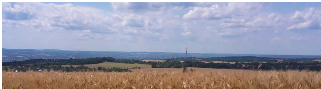
Aussicht vom Triebenberg (8)