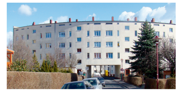
Briesnitzer Rundling (14)

Von der Haltestelle Gottfried-Keller-Straße der Linie 1 kann die Rückfahrt ins Stadtzentrum angetreten werden.