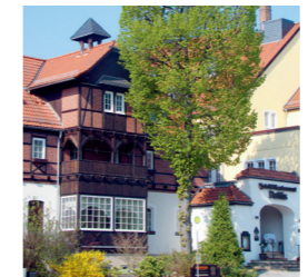
Ehemalige Weltmühle (11)

Geschenk der Stadt Dresden anlässlich der Eingemeindung von Kemnitz und Briesnitz errichtet, wurde es 1988 auf Grund baulicher Mängel geschlossen. Seit 1996 kümmert sich der Verein „NaturKulturBad Zschonergrund“ um dessen Wiederbelebung sowie die ganzjährige Nutzung. Mit dem aus Plänersteinen errichteten Dreiseithof von 1836 passt sich diese Anlage harmonisch ins Tal ein. Die Wiedereröffnung als selbstreinigendes Naturschwimmbad ist für 2012 geplant. 2010 wurde ein Kräutergarten mit über 50 Arten angelegt. An den Sonntagnachmittagen zwischen Ostern und dem Tag der Deutschen Einheit ist bereits ein Biergarten geöffnet.