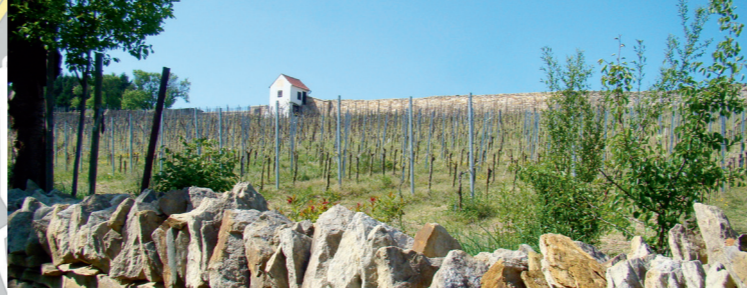
Merbitzer Weinberge (8)

dieser Stelle ein Denkmal. Beim Sommerhochwasser 1958 wurde es ins Bachbett gespült. Ein Rettungsversuch in den 80er Jahren des vorigen Jahrhunderts schlug fehl. Der Stein zerbrach in zwei Teile. Zum 10-jährigen Jubiläum der „Aktion Ameise“, einer Kindernaturschutzgruppe aus Briesnitz, wurden beide Teile geborgen, zusammengesetzt und am 8. Oktober 2005 eingeweiht.