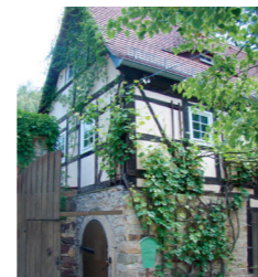
Zschoner Mühle (4)

Ein Rundweg aus dem idyllischen Tal führt hinauf nach Podemus. Unterwegs ist auf Tafeln einiges zum Thema