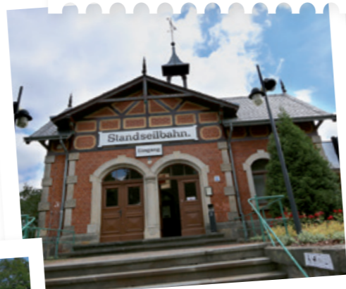
Standseilbahn (seit 1895)

Als lebendige technische Denkmäler prägen die Bergbahnen das Landschaftsbild am malerischen Loschwitzer Elbhänge seit über 120 Jahren.