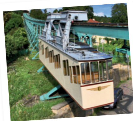
Schwebebahn (seit 1901)

Öffnungszeiten der Schwebebahn: im Sommer: täglich bis 20 Uhr im Winter: täglich bis 18 Uhr