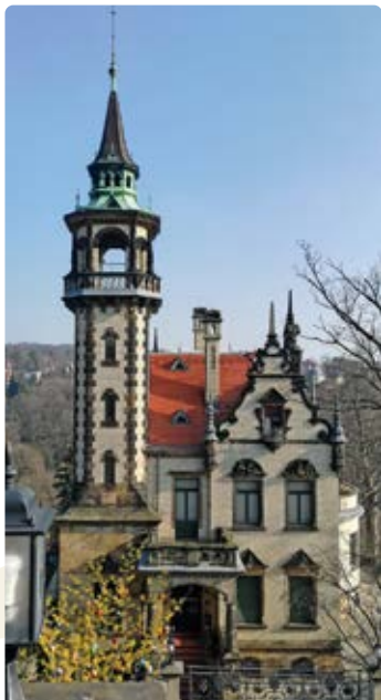
Villa San Remo (2)