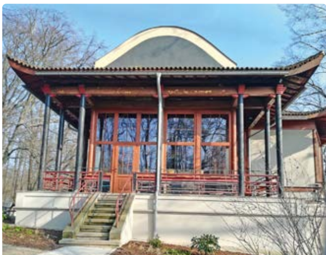
Chinesischer Pavillon (11)