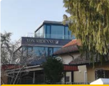
Gebäudekomplex VON ARDENNE

Laufen Sie die Bergbahnstraße entlang, bis diese in die Plattleite übergeht. Hier halten Sie sich rechts und gehen dann weiter geradeaus. Auf der linken Seite sehen Sie zuerst die Firmengebäude und dann die Sternwarte von Baron Manfred von Ardenne (3) , welcher hier das größte private Forschungslabor des ehemaligen Ostblocks betrieb.