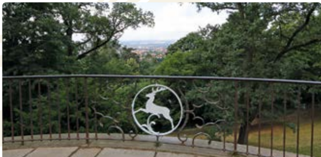
Aussicht vom Friedensblick (4)