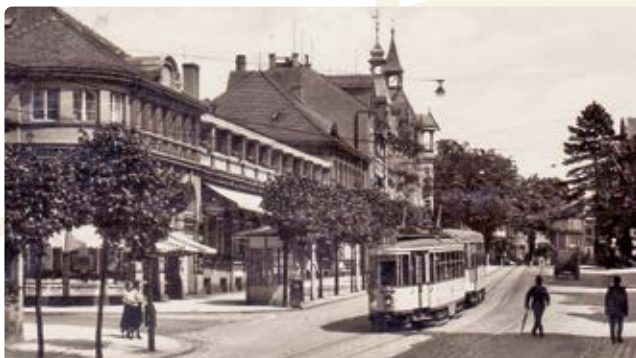
historische Ansicht Parkhotel, Postkarte von 1935 (9)

vor Kurzem gab es bei Bauarbeiten einen sensationellen Fund: Hinter einer Trockenbauwand aus den 80er-Jahren fand man etwa 100 Jahre alte Fenster. Sie zierten ursprünglich den Eingangsbereich des Hotels. Die Glasbilder zeigen u. a. den Dresdner Zwinger und den Weißen Hirsch. Nach der Restaurierung sollen sie den Besuchern wieder zugänglich gemacht werden. Heute ist das Parkhotel zwar kein Hotel mehr, aber noch immer bekannt für seine Veranstaltungen wie dem Hutball, Firmenevents oder der Ausstattung von privaten Feiern.