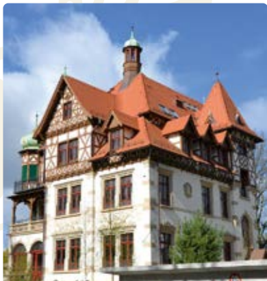
Villa Heinrichshof (10)

dem Ersten Weltkrieg Viktoria Luise von Preußen, Heinz Rühmann, Johannes Heesters, Zarah Leander, Heinrich Büssing, Hugo Junkers u. v. a. mehr. Mit Ausbruch des Krieges zog 1939 die Wehrmacht auf das Gelände und nach dem Krieg diente es als sowjetisches Militär Lazarett. Seit 2011 wird es umfassend saniert.