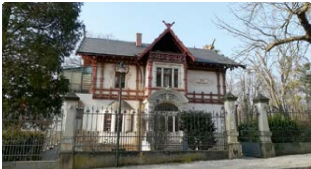
Villa Eschebach (8)