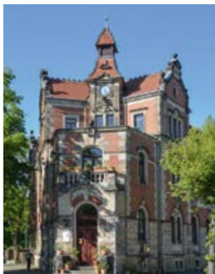
ehemaliges Rathaus (13)

Richtung. Wenn Sie nach rechts gehen, kommen Sie auf die Bernhard-Shaw-Straße und biegen anschließend nach rechts in die Seidelbaststraße. Die Bebauung dieses Stadtteiles wechselt zwischen Stadtvillen, Einfamilienhäusern des vergangenen Jahrhunderts und Wohnsiedlungen dieses Jahrtausends.