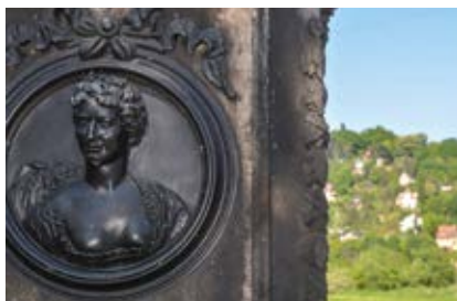
Gedenkstein F. C. Neuber (5)

Dresden. Sie verstarb im November 1760 in einem heute nicht mehr erhaltenen Nebengebäude des Volkshauses Laubegast, an dem Sie vorbeikommen, wenn Sie Ihren Weg an der Elbe fortsetzen. Der damalige Dorfgasthof wurde 1889 zum Ballhaus umgebaut. Bis 1945, als auch nach dem zweiten Weltkrieg, fanden hier regelmäßig Konzerte und Tanzveranstaltungen statt. In den 70er Jahren wurde der Ballsaal renoviert und verlor