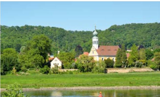
Kirche Maria-am-Wasser (9)