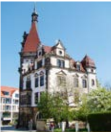
Rathaus Plauen (2)

Unser Streifzug auf den Spuren der Bienerts durch Plauen und den Plauenschen Grund beginnt am F.-C.-Weißkopf-Platz (1) , den Sie über die Haltestelle Plauen, Rathaus mit den Buslinien 62, 63 und 85 erreichen.