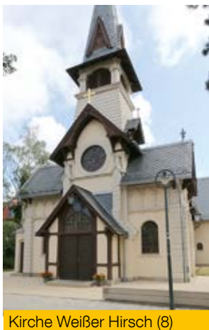
Kirche Weißer Hirsch (8)

Durch die Oskar-Pletsch-Straße wandern Sie hinauf in die Stangestraße. Die dort 1888 erbaute Evangelische Kirche Weißer Hirsch (8) ähnelt der berühmten Kirche Wang im Riesengebirge. An der Plattleite angelangt, können Sie noch einen Abstecher zum Zentrum des ehemaligen Kurorts Weißer Hirsch (9) machen. An der Bautzner Landstraße befand sich seinerzeit die wohl