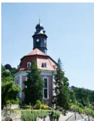
Loschwitzer Kirche (1)

Ihr Spaziergang beginnt am Körnerplatz in Loschwitz unweit des Blauen Wunders. Den Körnerplatz erreichen Sie mit den Buslinien 61, 63 oder 84/309. Von hier aus laufen Sie knapp 100 Meter die Pillnitzer Landstraße in stadtauswärtiger Richtung bis zur Talstation der Schwebebahn entlang.