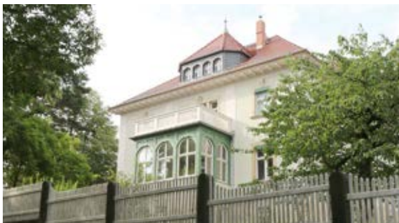
Villa in der Sierksstraße (3)

Der Ortsteil Oberloschwitz entstand Ende des 19. Jahrhunderts, als der Hofbuchhändler Heinrich Warnatz die vormaligen Felder und die durch Reblausbefall aufgelassenen Weinberge aufkaufte und erschließen ließ. Interessant ist, dass bis 1945 der Ortsteil südlich der Grundstraße Schöne Aussicht genannt wurde. Ein Restaurant gleichen Namens mit sechs charmanten Zimmern und einem eindrucksvollen Weinkeller finden Sie auf der Krügerstraße 1.