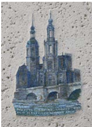
Mosaik Haus Sonnenleite (5)

Gehen Sie in die Sonnenleite. Das Haus Sonnenleite 9 (5) mit seinem schmückenden Mosaik gehörte einst dem sehr gefragten Architekten Wilhelm Kreis (1873–1955). Er baute u. a. das Deutsche Hygiene-Museum in Dresden (1928–30) und rund 50 Bismarcktürme in ganz Deutschland. Wenige Meter weiter können Sie auf der Sonnenleite 15 nach