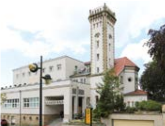
Restaurant Luisenhof (12)

Zurück zur Plattleite gelangt, werfen Sie als Nächstes einen Blick auf das Gebäudeensemble Plattleite 19–31 (11) . Dabei handelt es sich um die Institutsgebäude und Sternwarte des Physikers Baron Manfred von Ardenne (1907–1997). Ardenne, der ein genialer Erfinder und emsiger Entwickler war, betrieb hier das einzige private Großforschungsinstitut der ehemaligen DDR.