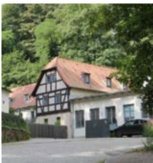
Haus Ulrichstraße 5 (4)