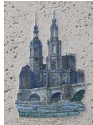
Mosaik Haus Sonnenleite (5)