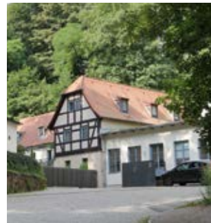
Haus Ulrichstraße 5 (4)