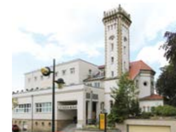
Restaurant Luisenhof (12)

Zurück zur Plattleite gelangt, werfen Sie als Nächstes einen Blick auf das Gebäudeensemble Plattleite 19–31 (11) . Dabei handelt es sich um die Institutsgebäude und Sternwarte des Physikers Baron Manfred von Ardenne (1907–1997). Ardenne, der ein genialer Erfinder und emsiger Entwickler war, betrieb hier das einzige private Großforschungsinstitut der ehemaligen DDR.