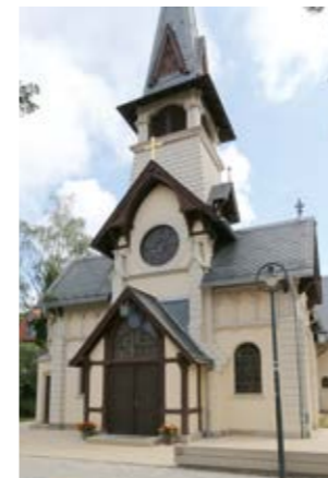
Kirche Weißer Hirsch (8)

Durch die Oskar-Pletsch-Straße wandern Sie hinauf in die Stangestraße. Die dort 1888 erbaute Evangelische Kirche Weißer Hirsch (8) ähnelt der berühmten Kirche Wang im Riesengebirge. An der Plattleite angelangt, können Sie noch einen Abstecher zum Zentrum des ehemaligen Kurorts Weißer Hirsch (9) machen. An der Bautzner Landstraße befand sich seinerzeit die wohl