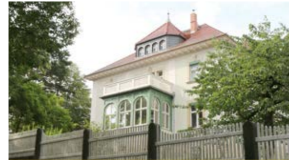
Villa in der Sierksstraße (3)