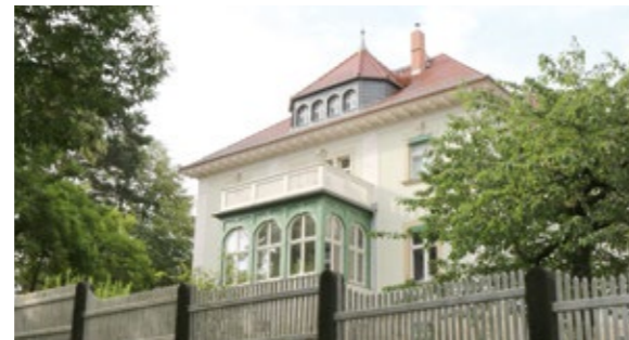
alte Villa in der Sieksstraße (3)