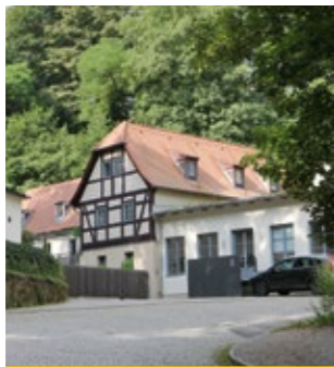
Haus Ulrichstraße 5 (4)

Kurz darauf gelangen Sie in die Ulrichstraße. Sie erinnert an die Dresdner Hofschauspielerinnen Pauline Ulrich (1835-1916), Deutschlands erste Professorin für Schauspielkunst. Im Haus Ulrichstraße 5 (4) , dem ehemaligen Restaurant „Schweizeri“, sprach am 1. Mai 1890 der Mitbegründer der deutschen Sozialdemokratie August Bebel vor Hunderten von Arbeitern. Aus der Ulrichstraße heraustretend kommen Sie auf die Grundstraße, die ein ganzes Stück vom heute zum Teil kanalisierten, in die Elbe mündenden Loschwitzbach „Trille“ begleitet wird. Einst lagen sechs Mühlen an ihrem Lauf, zudem versorgte sie eine Silberschmelze mit Wasser.