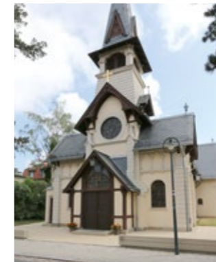
Kirche Weißer Hirsch (8)

An der Plattleite angelangt können Sie noch einen kurzen Abstecher zum Zentrum des ehemaligen Kurorts Weißer Hirsch (9) machen. An der Bautzner Landstraße befand sich seinerzeit die wohl bekannteste der zahlreichen Kureinrichtungen, das Lahmann-Sanatorium. „NATURA SANAT – die Natur heilt“ war der Leitspruch des jungen Arztes, in dessen moderner naturheilkundlicher Anstalt wohlhabende Kurpatienten aus der ganzen Welt, darunter vom russischen Zarenhof und dem rumänischen Königshaus, Heilung von z. B. Atem-, Herz- und Kreislaufbeschwerden suchten. Über das vor einigen Jahren neu gestaltete Ortsteilzentrum mit ehemaligem alten und neuen Kurbad, den Lahmannring und die Collenbuschstraße führt der Abstecher weiter zum 1932 geschaffenen Aussichtspunkt Blombergblick (10) .