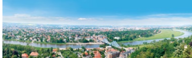
Panoramablick von der Bergstation der Schwebebahn (2)

Wer die Wanderung abkürzen möchte, biegt nach 200 Metern auf der linken Seite in den Oberen Ziegengrundweg ab. Für den direkten Weg zur Bergstation der Standseilbahn sollten Sie festes Schuhwerk tragen, die Strecke ist nicht barrierefrei. Je nachdem wie schnell Sie gehen, benötigen ca. 15 bis 25 Minuten. Der Obere Ziegengrundweg führt Sie über mehrere Stufen und einen Waldweg hinab ins Tal. Nach wenigen Minuten erreichen Sie den Karl-Schmidt-Weg, dem Sie links bis zur Grundstraße folgen. Über den kleinen Häusern entlang der Grundstraße können Sie ein Foto vom Brückenviadukt der Standseilbahn aufnehmen. Mit ein bisschen Glück sehen Sie auch die beiden Fahrzeuge der Standseilbahn, die sich genau an dieser Stelle treffen. Nachdem Sie die Grundstraße überquert haben, führt der Sandweg nun wieder bergauf.