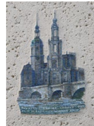
Mosaik Haus Sonnenleite 9 (5)