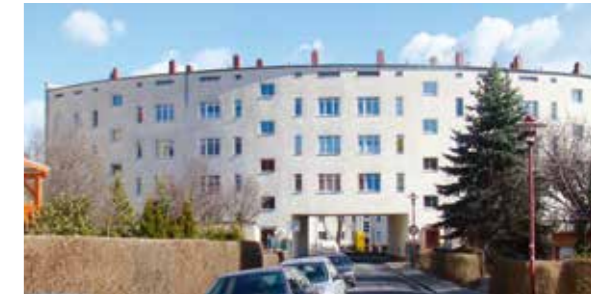
Briesnitzer Rundling (14)

Von der Haltestelle Gottfried-Keller-Straße der Linie 1 kann die Rückfahrt ins Stadtzentrum angetreten werden.