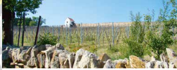
Merbitzer Weinberge (8)