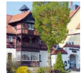
Ehemalige Weltemühle (11)

Unmittelbar hinter dem Bad führt eine Treppe hinunter in den schattigen Grund. Eine wuchtige Mauer aus dem 90 Millionen Jahre alten Pläner vom Grunde des Kreidemeeres schützt unseren Weg. Er wird auch „Plauener Stein“ genannt, nach dem Entdeckungsort Dresden-Plauen. Schon ist die ehemalige Weltemühle (11) am Ausgang des Tales erreicht. Sie avancierte nach 1870 zu einem beliebten Ausflugsziel im Dresdner Westen. Um 1900