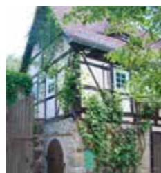
Zschoner Mühle (4)