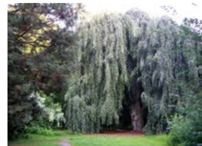
Helfenberger Park (7)

Weitere Informationen zum gesamten Verlauf des DMM-Wegs bis in die Sächsische und Böhmisches Schweiz, alle Stempelstellen sowie die dazugehörige Übersicht der DMM-Wandergesell-Abzeichen in Bronze, Silber und Gold erhalten sie auf der Internetseite www.dmm-weg.de .