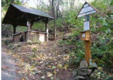
Stempelstelle Wachbergschänke (6)

Das hier beschriebene Teilstück des Dichter-Musiker-Maler-Weges (DMM) verläuft von Loschwitz bis nach Graupa durch die Kulturlandschaft der Elbhänge, vorbei an Wohn- und Wirkungsstätten vieler Künstler aus den Bereichen Literatur, Malerei und Musik, an wiedererstandenen Weinbergen und zahlreichen Aussichtspunkten hin zu Stätten sächsischer Geschichte. Entlang des Weges befinden sich verschiedene Gaststätten, die zum Verweilen einladen. An der Strecke bis Graupa sind zudem die ersten sieben Stempelstellen (ST-0 bis ST-6) zur Erlangung des Dichter-Musiker-Maler-Wandergesells zu finden.