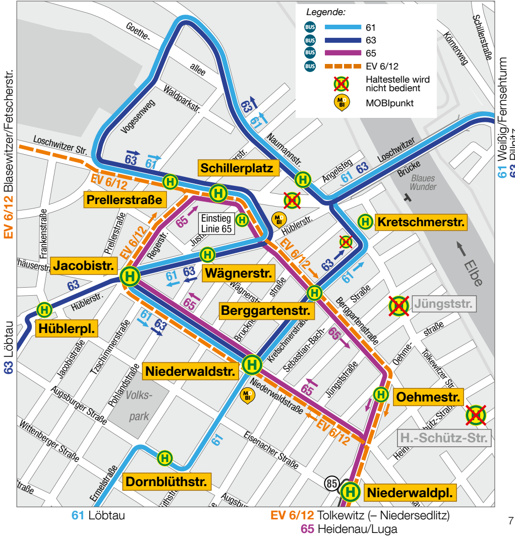
Bauphase C: Übersicht Haltestelle Schillerplatz und Umgebung